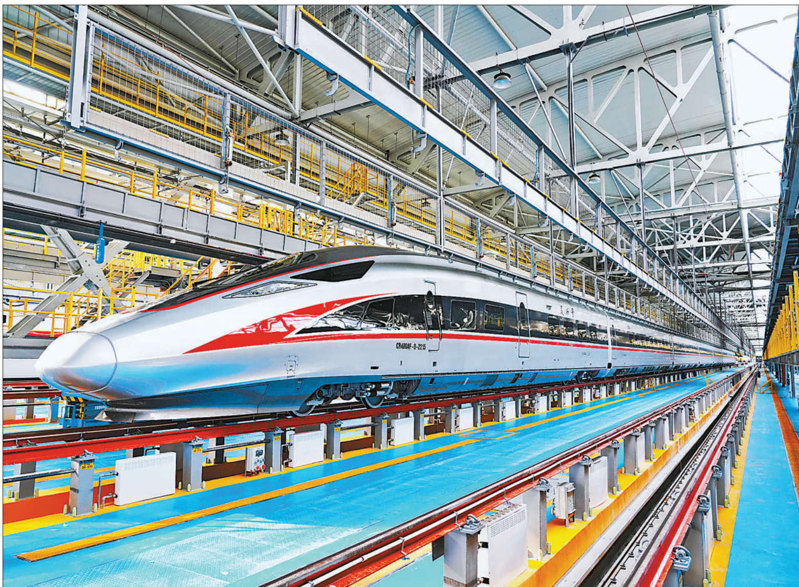
时速350公里 复兴号高寒动车组亮相 目前进入运行试验阶段

不靠海、不沿边,农业生产瞄准高质高效 通海蔬菜 远销海外 本报记者 张帆 李茂颖 冬日沃野,杞麓湖畔生机勃勃,平整连片的菜地一望无际。在云南省通海县秀山街道种植区,笔直的田埂将田野划分出纵横交错的格子,格子里种满了品种各异、色泽鲜润的蔬菜,宛若一块块调色板。 秀山街道大树社区人均仅五分田,村民们都是精耕细作种菜的好手。 “在我们这儿,家家户户都种菜。”大树社区党总支书记赵思旺一脸自豪,“这几年,我们把菜卖到了泰国、越南,最远出口到了中东。” 通海是云南省知名蔬菜生产基地和集散地,近年来深入推进农业供给侧结构性改革,推动品种培优、品质提升、品牌打造和标准化生产。尽管不靠海、不沿边,通海蔬菜产量36%销往国外。2020年,全县农村居民人均可支配收入预计达19615元,较2015年增加6980元,年均增长9.2%。 蔬菜远销海外,靠什么?“品质好。”赵思旺答道。 大树社区1998年开始推广种植蔬菜,到2016年前后,赵思旺和村民们都有一个共同感受:靠传统生产方式,蔬菜产业难以突破发展的“天花板”;要打开发展新空间,必须瞄准高质高效发力。 走进大树社区蔬菜种植区,黄色的粘虫板、错落有致的太阳能灭虫灯颇为醒目。再仔细看,地里还有最新安装的喷灌设备。 “近年来,基础设施在不断完善,绿色种植、科技种植让我们的蔬菜品质更好,这是我们的核心竞争力。”赵思旺指着地里整齐的蔬菜说,“我们这几种菜,从品种选定、有机肥提供,到栽种的行距、株距,都有统一的标准和技术指导。” (下转第二版)