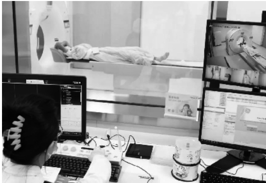
9月26日，全新数字光导PET/CT在复旦大学附属儿科医院PET中心启用，这是首家配备正电子显像检查系统的国家儿童医学中心。图为医生为患者做PET/CT检查。尹薇报道