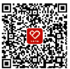
第五届人民名医盛典：推荐医者榜样 引领尊医舆论