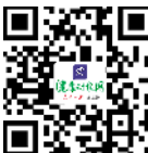
健康时报网：精品健康新闻 健康服务专家