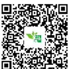
十四届健康中国论坛：新阶段新理念新格局