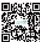
视频大夫说：权威专家 说尽健康事儿