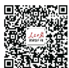
人民日报健康客户端：权威医生在身边