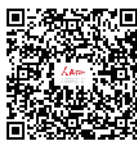
人民名医直播：我与名医零距离