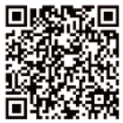
快手：健康时报原创短视频