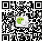
健康时报微信：因专业而信赖