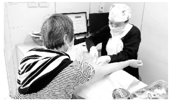
上海市第十人民医院自2012年首开综合护理门诊起，不断丰富护理门诊的模式，或设置单独诊室、或嵌入相关临床诊室，11年来先后推出17个护理门诊为患者服务。生星报道