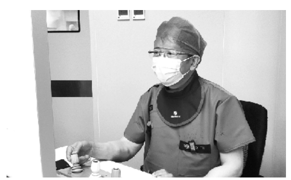
近日,中国科学技术大学附属第一医院(安徽省立医院)马礼坤教授团队率先在安徽省内开展介入机器人辅助下冠状动脉手术,介入医生实现“室外”操作、精准操作。方咏报道