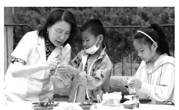
5月20日~5月31日是第29届北京科技周。北京儿童医院将诊室搬到现场,医护人员通过角色扮演、实操体验等方式,聚焦近视防控、儿童营养等话题,吸引儿童参与。牛宏超报道