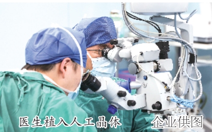
医生植入人工晶体