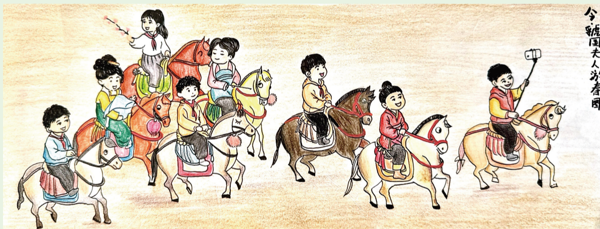
▲今·魏国夫人游春图 刘澍(12岁)

本栏目部分漫画由《飒刺与幽默》报大连嘉汇研习基地(培根学校)供稿 指导教师:丁子力