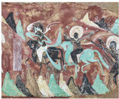
《鹿王本生图》壁画节选

1981年上海美术电影制片厂出品的25分钟短片《九色鹿》，改编自敦煌莫高窟257窟北魏壁画《鹿王本生图》，该片将北魏艺术风格融入角色造型与场景设计，是首部系统展现敦煌艺术的动画电影。