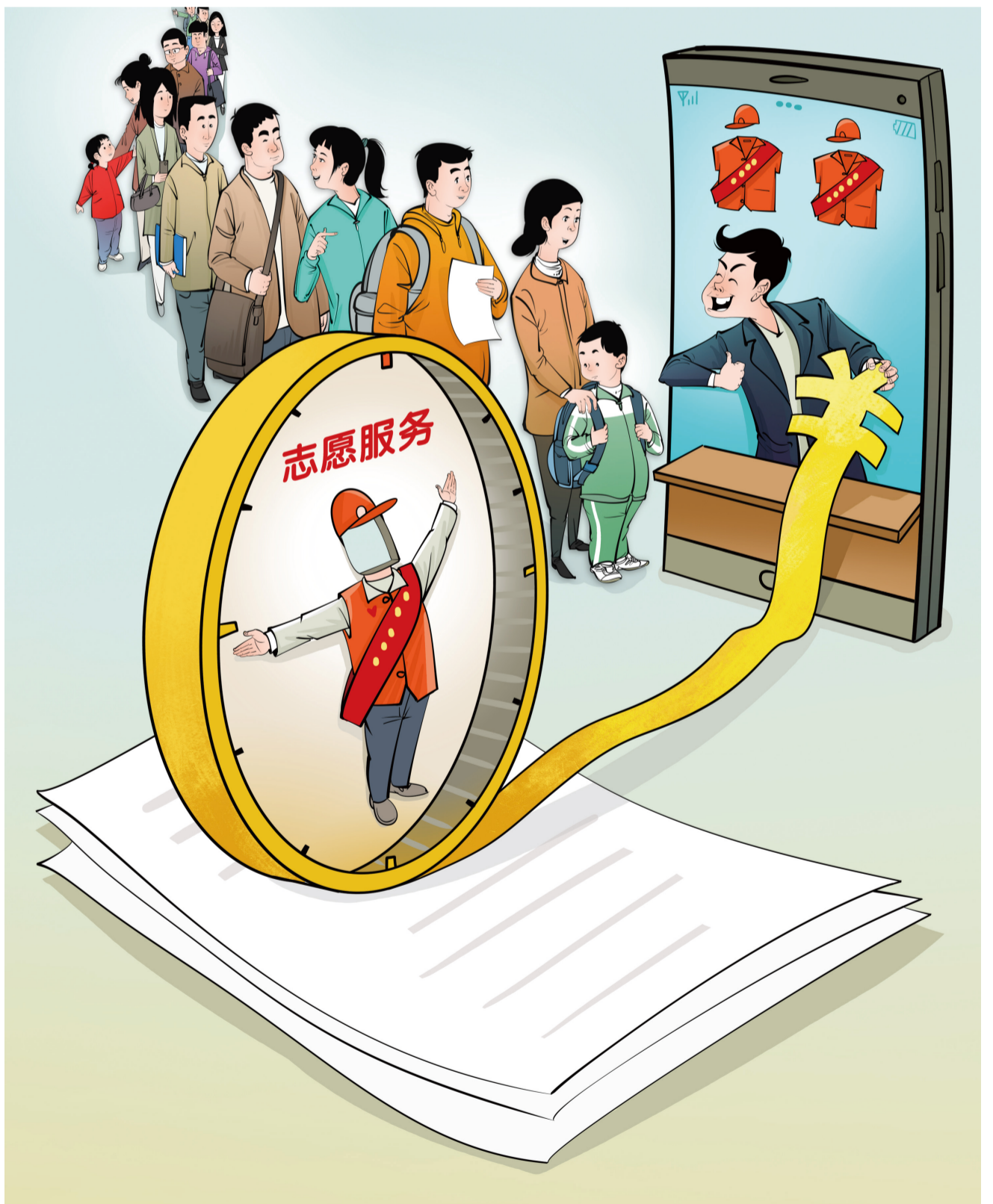
▲不该存在的生意 曹 一