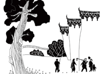
⑤ 此后，军阀、日寇等多方势力觊觎该盘，刘家后人将其深埋于后院槐树下。