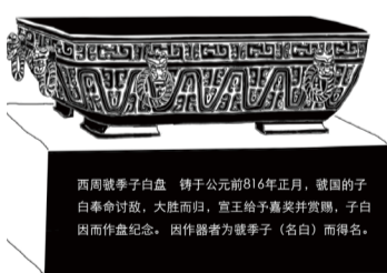
⑥ 新中国成立后，刘铭传后人将“西周虢季子白盘”献出，后入藏中国国家博物馆。