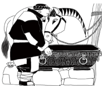
① 虢季子白盘于清朝道光年间，出土于陕西宝鸡，曾被当地农民用以喂马。