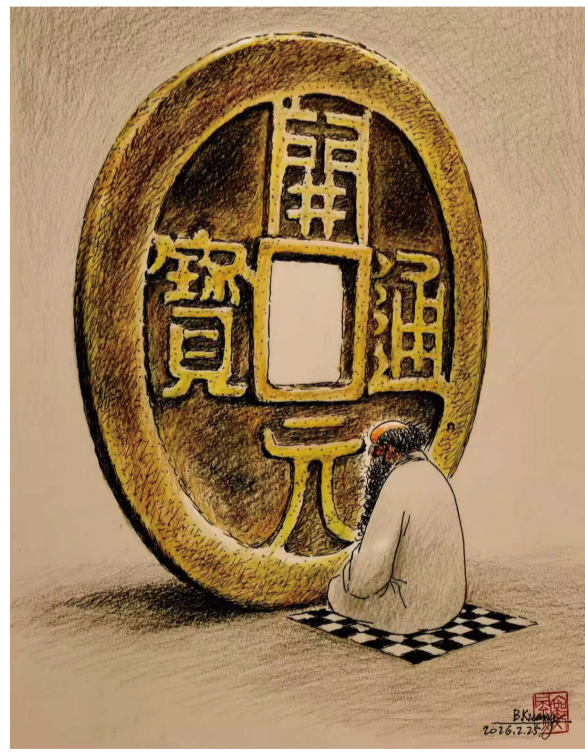
▲ 面“壁”思过 邝颺