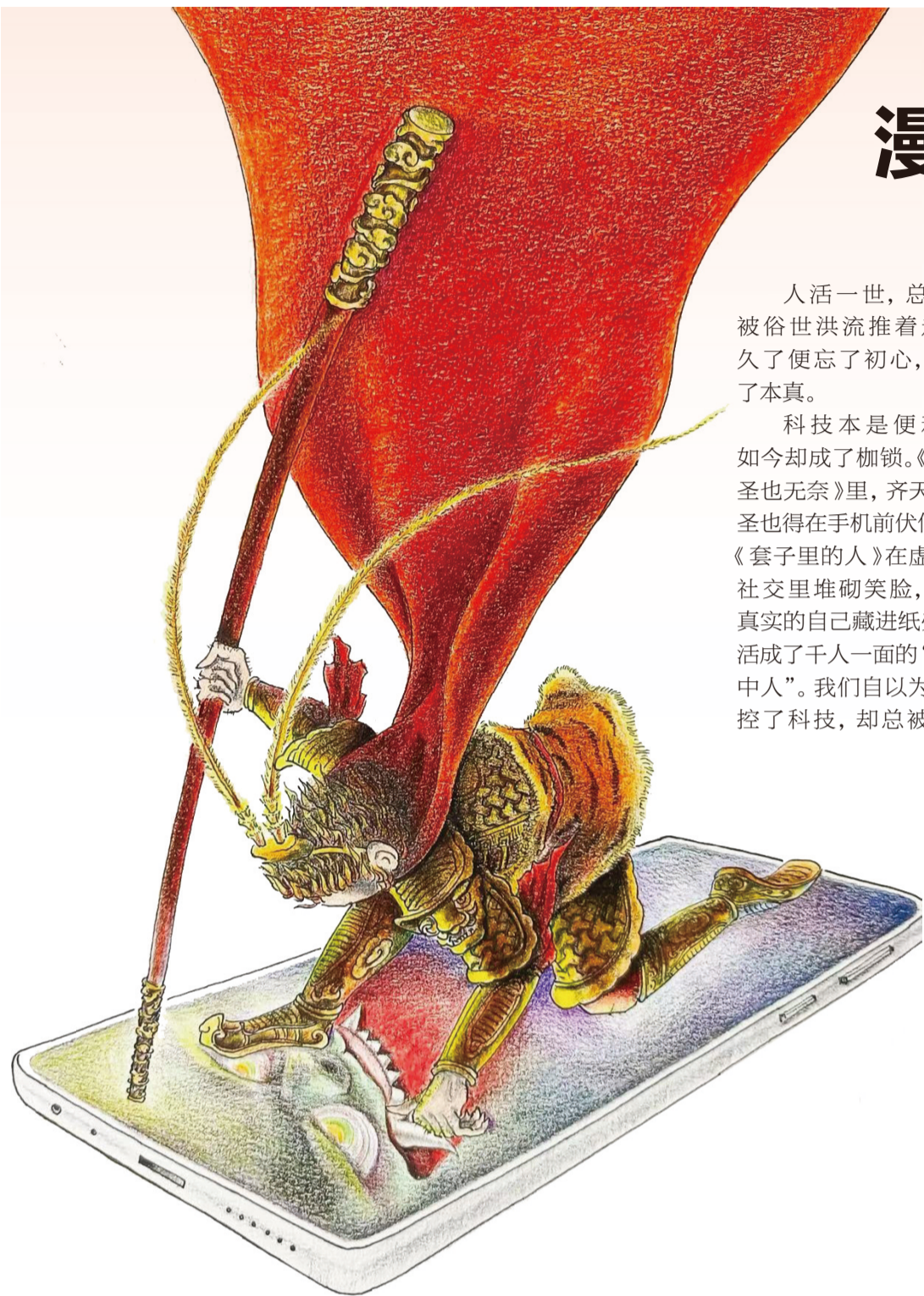
▲ 大圣也无奈 史庆合

方寸漫画藏万象，寥寥笔墨醒世人。褪去虚浮，远离喧嚣，不被裹挟，方能活得通透自在。