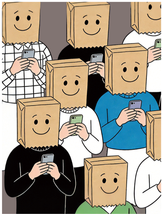
▲ 套子里的人 贾萌 (与AI合作创作)