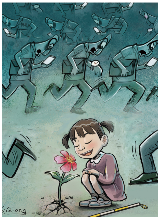
▲ 盲童的幸福 刘强