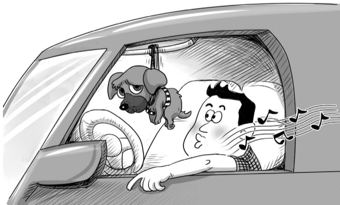
图 | 小栗子