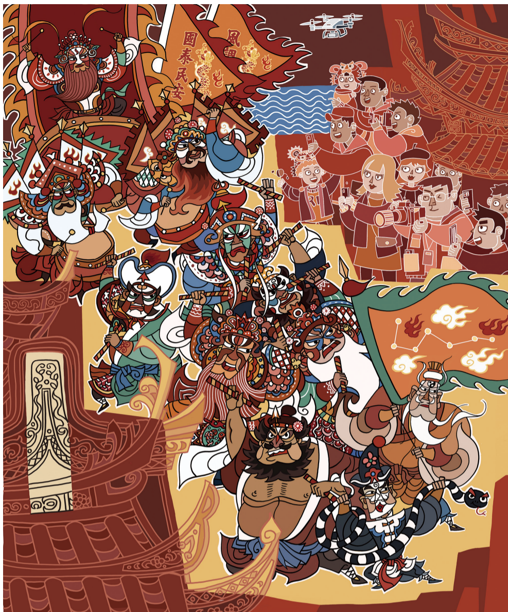
▲ 英歌炫春 杨耀辉