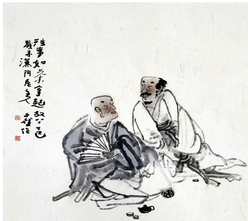
▲往事如茶 拿起放下 张文斌