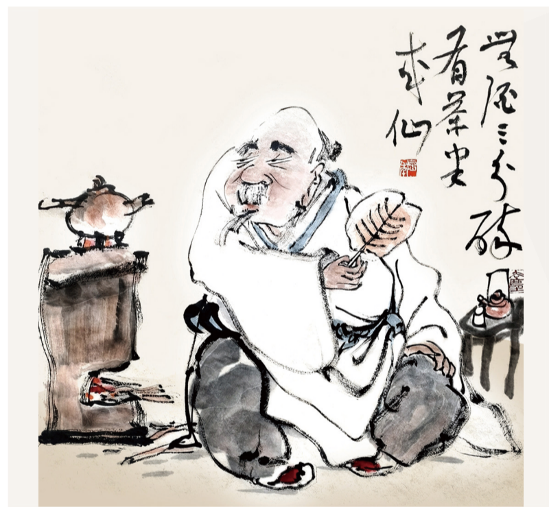
▲无酒三分醉 有茶半成仙 卞增年