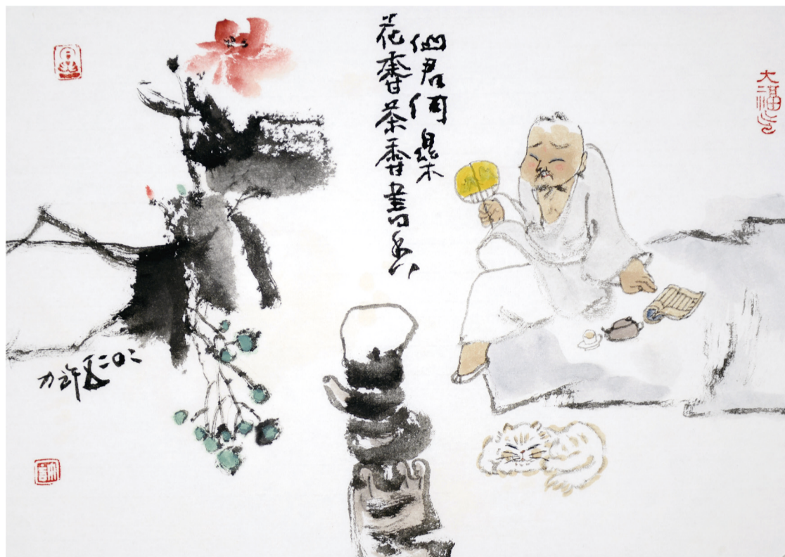
▲问君何乐 花香 茶香 书香 许力