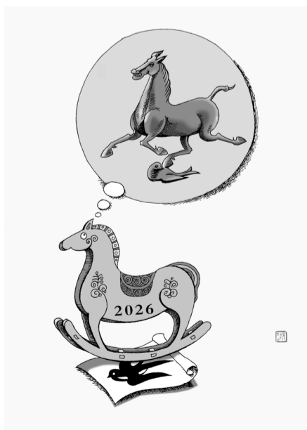
▲ 梦想成真 张超