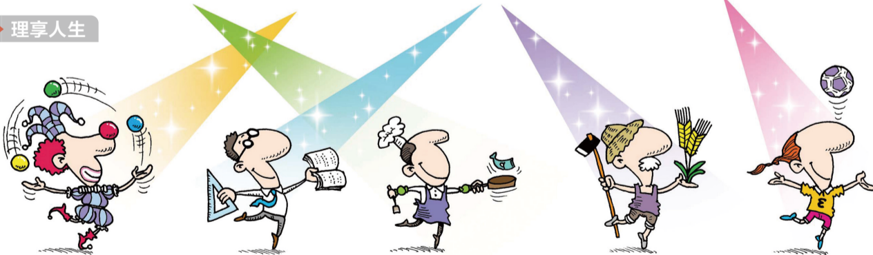
人生和球场都是舞台，当需要你演出的时候，就应该尽全力。