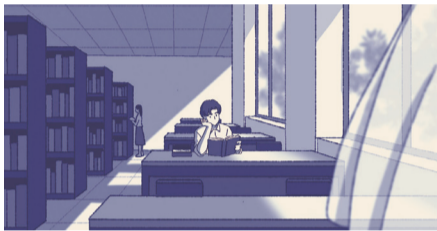
喜欢去图书馆看书