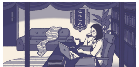
妈妈是某医院的科室主任 (未完待续……)