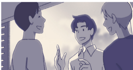
和他交流如沐春风