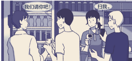
(接上回) 弄得我们都挺不好意思的