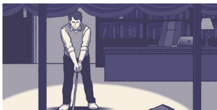
他爸爸有自己的公司