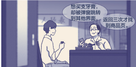
连班主任也很喜欢叫他去办公室聊天