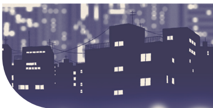
你是不是觉得他是从寻常人家里冲出来的?