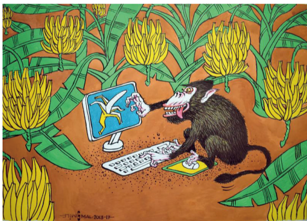
▲ 兴趣所在 古弗 (墨西哥)

虚拟世界正悄然消解人们直面现实、连接现实的能力。指尖滑动替代了促膝长谈，虚拟成就盖过了现实成长，社交平台上的光鲜人设，更取代了生活本真的喜怒哀乐。我们在点赞与关注的虚幻泡沫中迷失方向，看似手握更广阔的人际连接，实则陷入更深的孤独。毕竟，虚拟的繁华终究是镜花水月，现实里的点滴烟火，才是支撑人生的坚实底色。