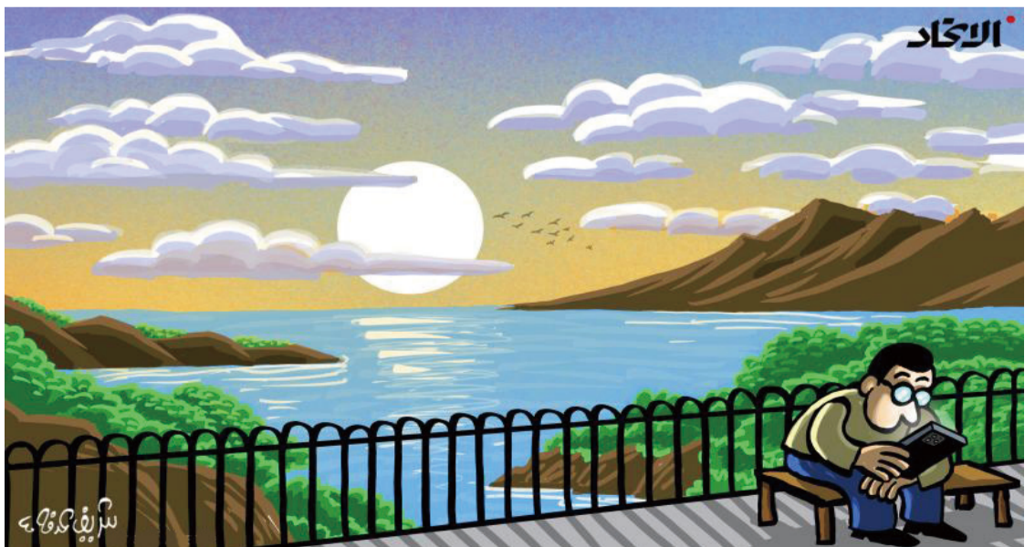
▲ 美景 谢里夫·阿拉法 (埃及)