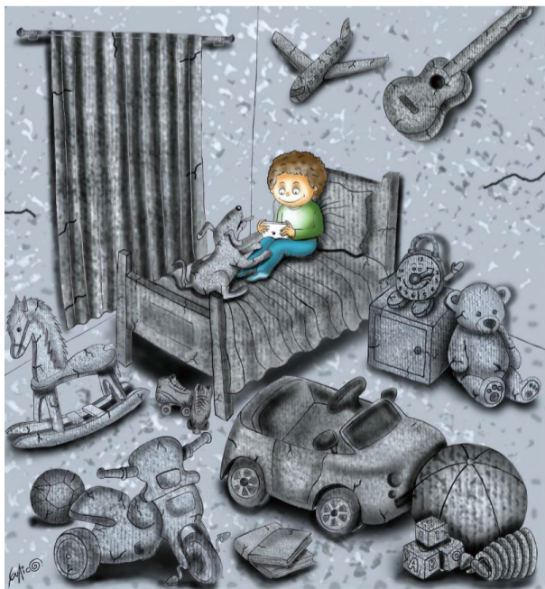
▲ 成瘾 劳尔·格里萨莱斯 (哥伦比亚)