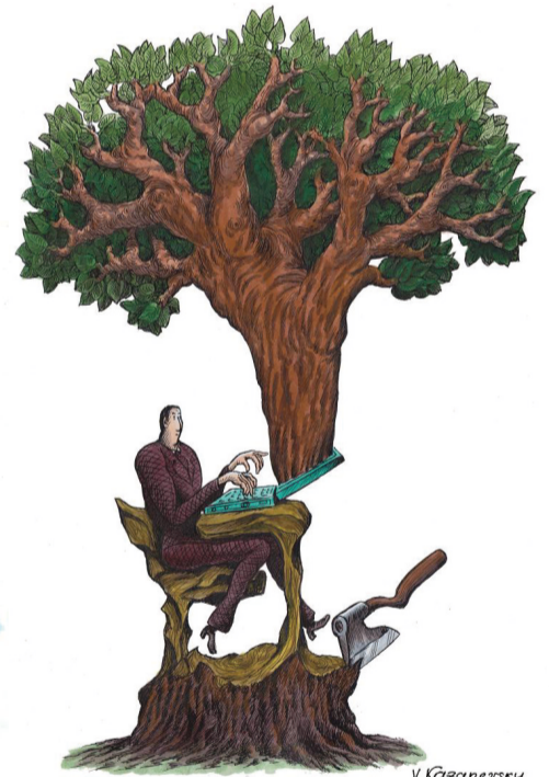
▲ 虚拟树 弗拉基米尔·卡扎涅夫斯基 (乌克兰)