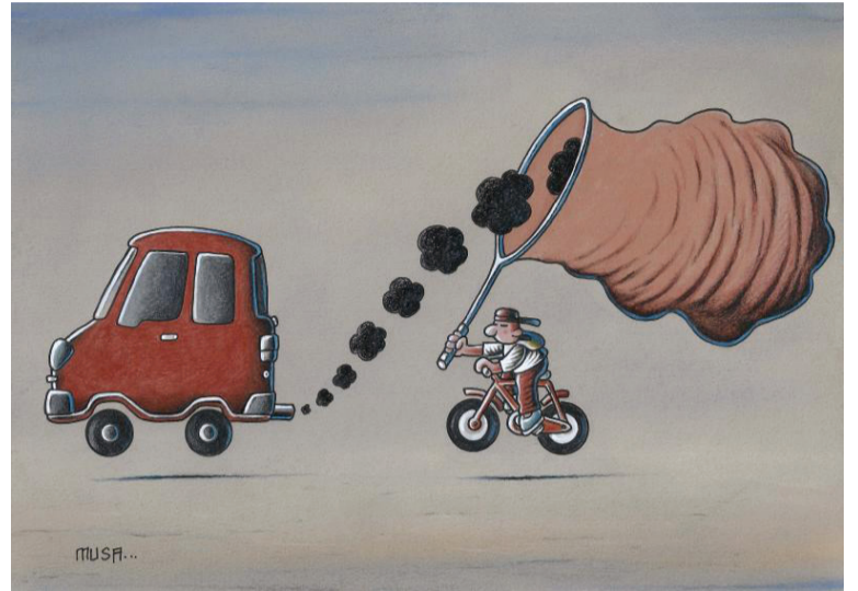
▲ 尾气猎手 穆萨·古穆斯(土耳其)