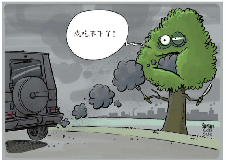
▲ 吃得太饱 加蒂斯·斯卢卡(拉脱维亚)