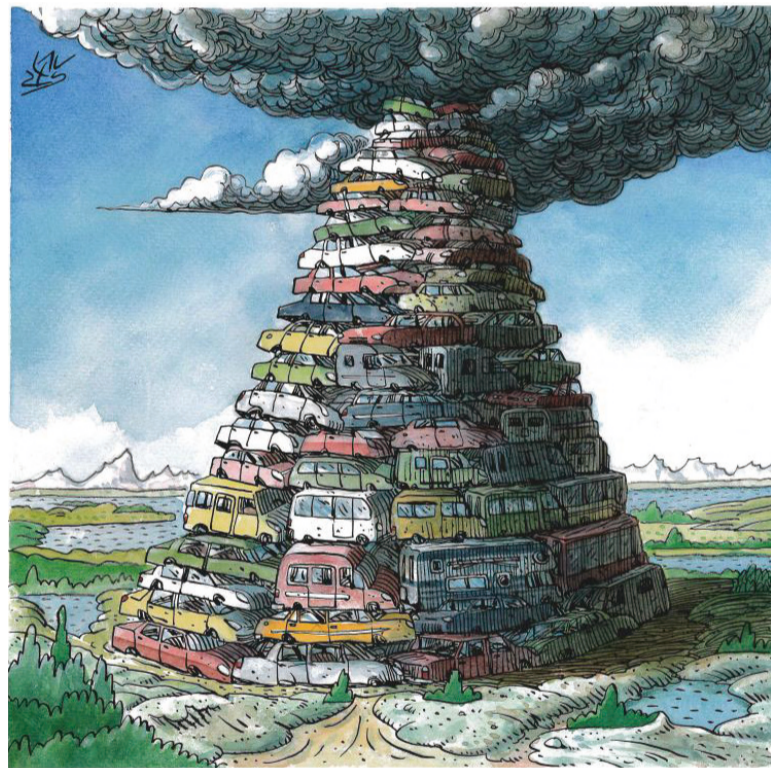
▲ 汽车之塔 阿伦·劳赞(智利)