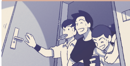
(接上回)其他人回到寝室推开门