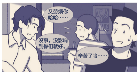
弄得其他人都很不好意思