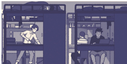
后来,他每3天就拖一次地,拖得干干净净