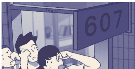
出门后看看门牌又揉揉眼睛,发现并没走错