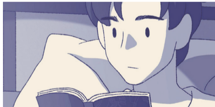
但他并非是出于强迫症般的洁癖