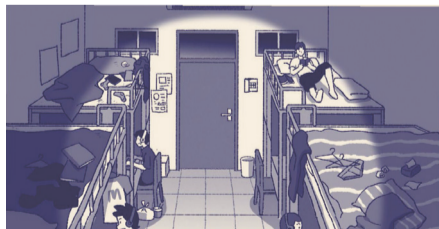
他只是需要一个干净的环境而已