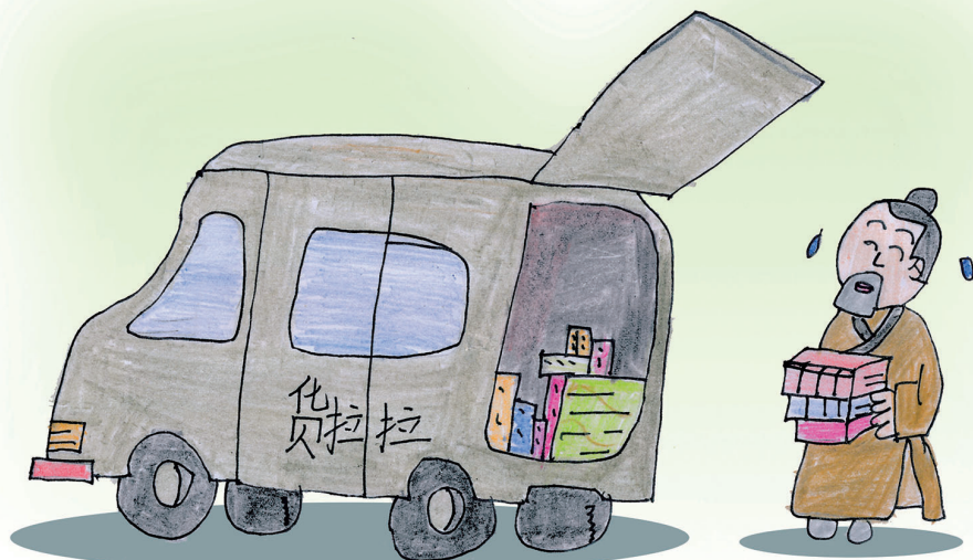
孔夫子搬家——尽是书(输)