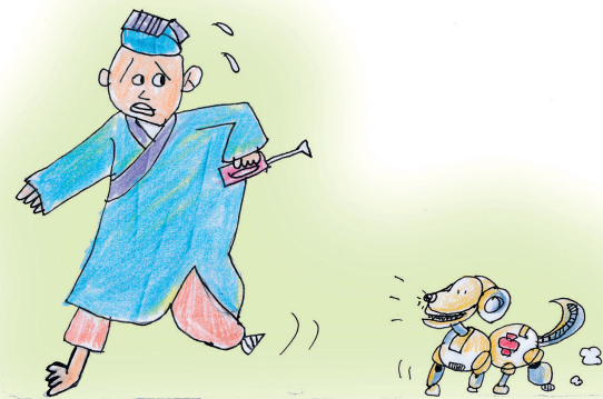
狗咬吕洞宾——不识好人心