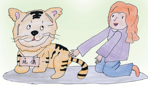
老虎的屁股——摸不得