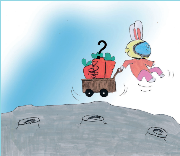
兔子拉车——连蹦带跳