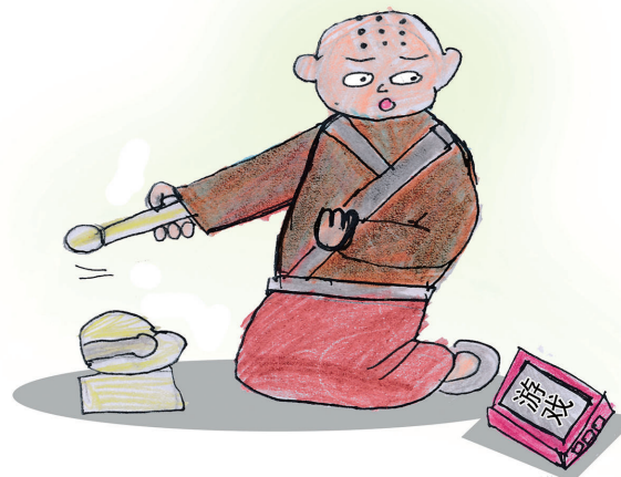
小和尚念经——有口无心