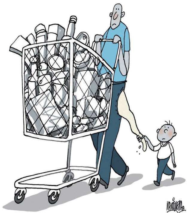
↑囊空如洗 阿尔弗雷多·马蒂雷纳(古巴)