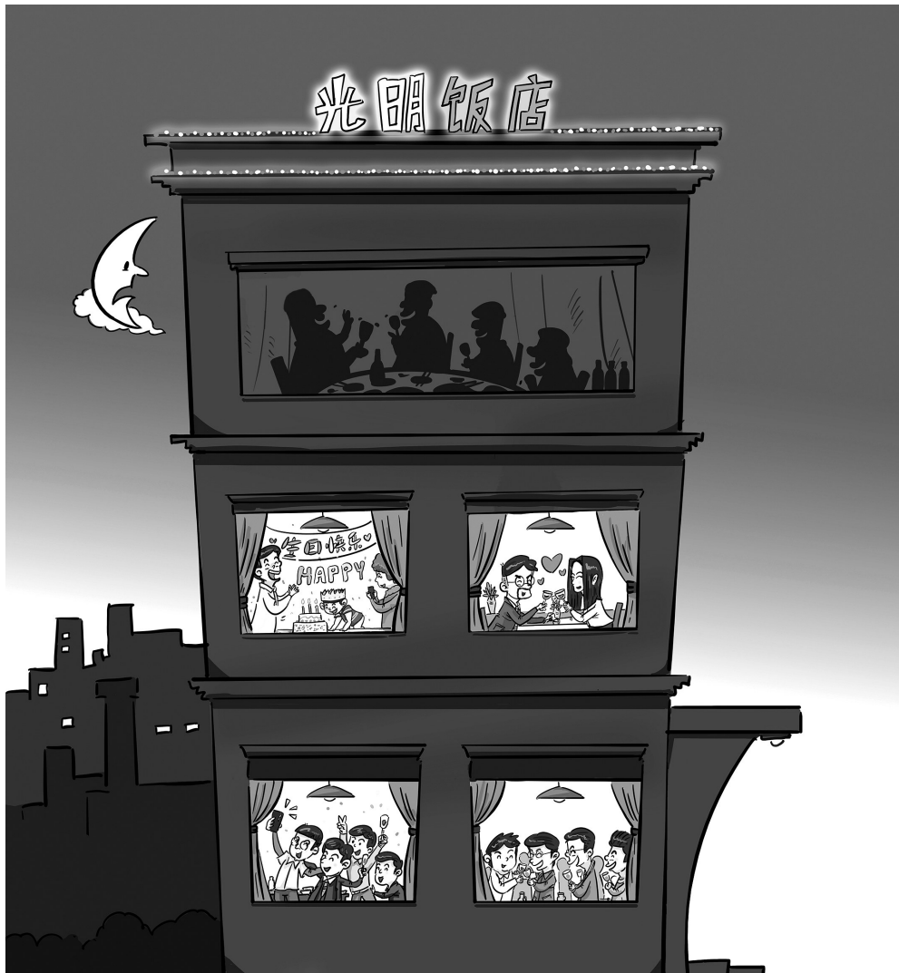
↑ 遮光 何剑伟