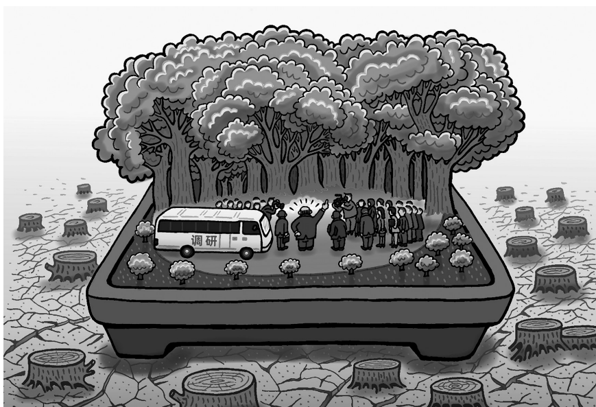
这绿化搞得不错嘛!