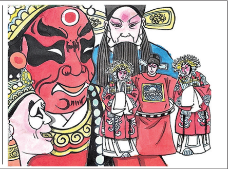
三人婚配全在我,好似牛郎渡星河。