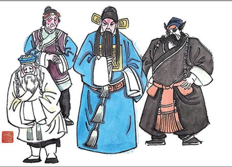
心神不定坐马上,死里逃生抓犯人。