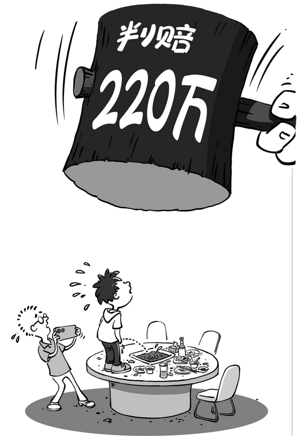
昂贵的一课 马宏亮

今年3月,两名未成年男生往上海一家海底捞火锅店的火锅里小便的事件曾引发广泛关注,近日,上海市黄浦区人民法院判决两名未成年人及其监护人向海底捞方面赔偿经营损失和商誉损失及维权开支,共计220万元。——父母不愿教训的孩子,自会有社会、法律帮着教育好。