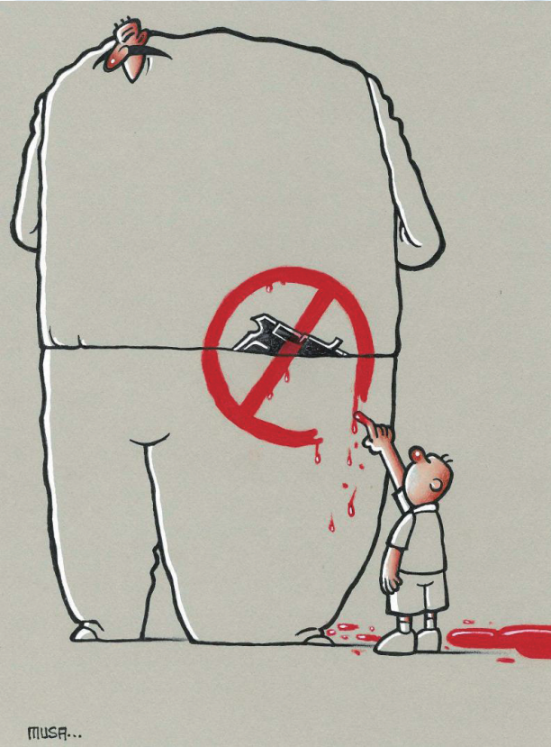
禁枪 穆萨·古穆斯(土耳其)