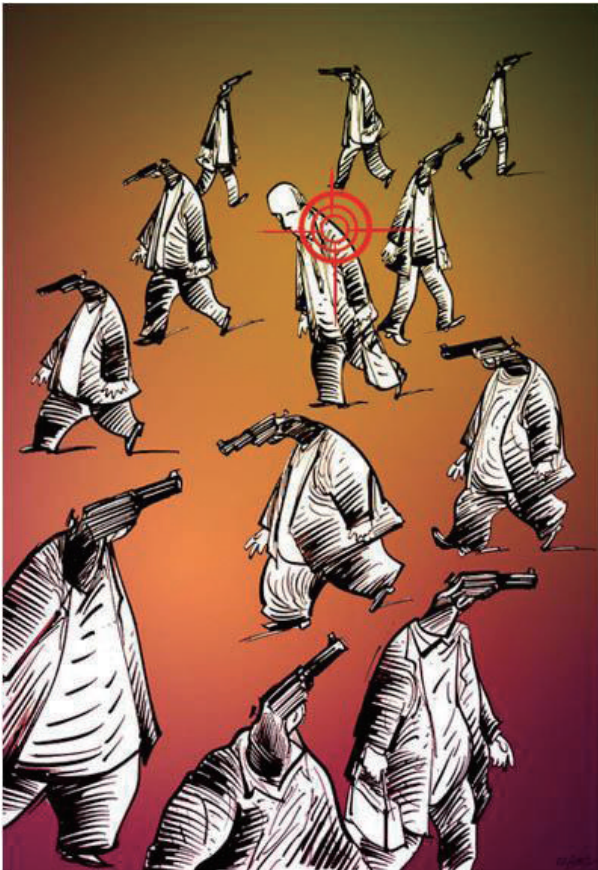
目标 奥古兹·古雷尔(土耳其)