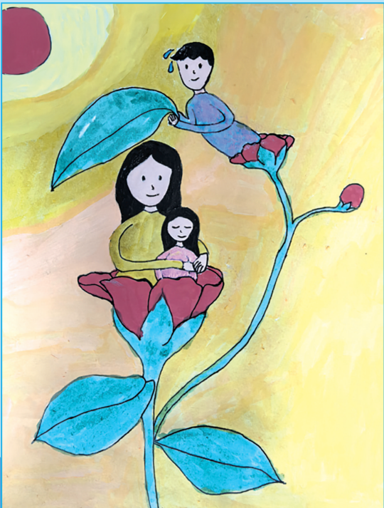
我有一个挡风雨的爸爸