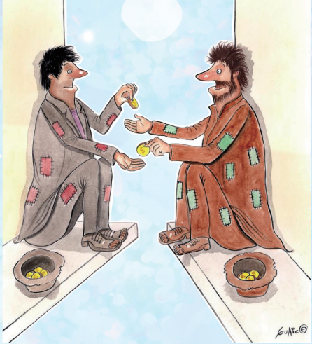
互助 瓜伊科(哥伦比亚)