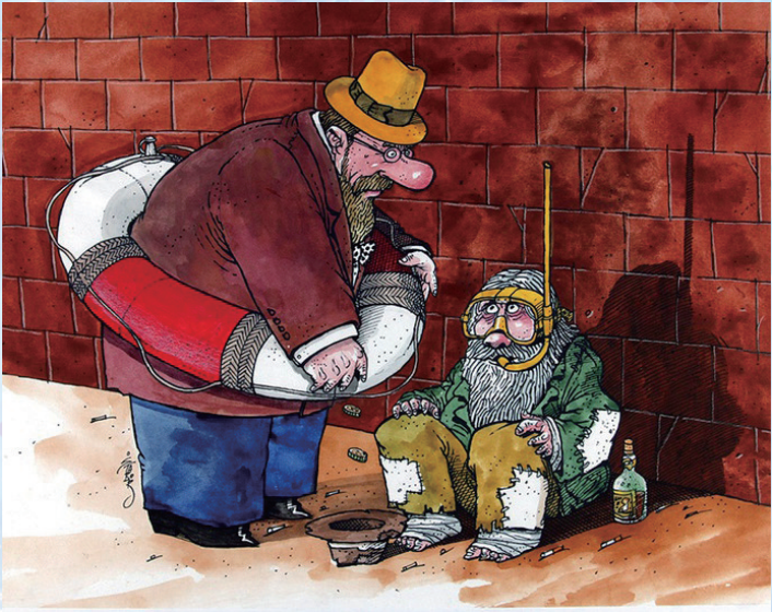
善良 博里斯拉夫·斯坦科维奇(塞尔维亚)