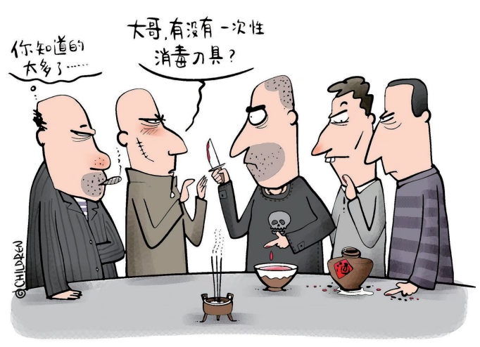
喝血酒有风险, 拜把子需谨慎