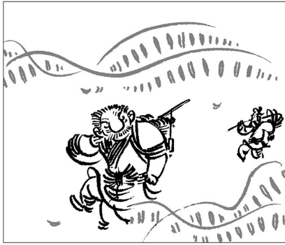
2. 俩人都是庄稼人，农闲时把自家的菜拿到集市去卖。这天菜不好卖，他们往家赶的时候天已经黑了。