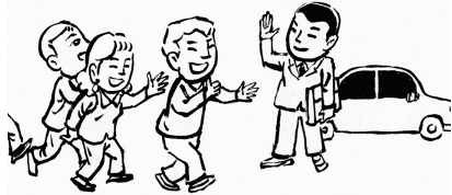
5. 墩子发达的消息传遍了全村，人们对他也格外热情起来。