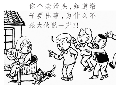
8. 人们忽然想起，这次高息借钱，全村只有老根头没掏钱，一伙人怒气冲冲地质问老根头。