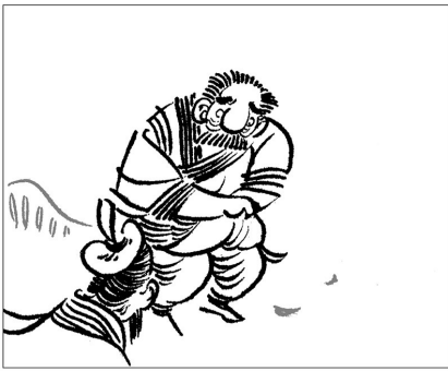
9. 老王听了更加疑惑：“报恩，恩从何来？”