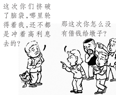
10. 人们一时语塞，低声再次问老根头……