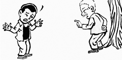
2. 正好遇到散步回来的老根头，墩子眼含泪光地向老根头诉苦。