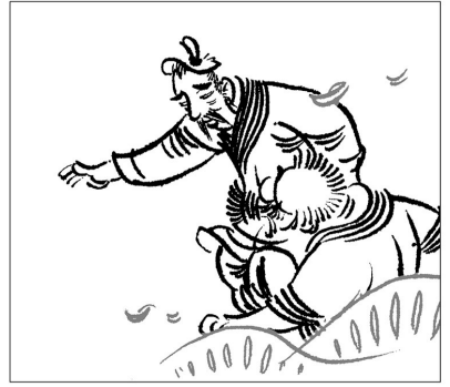
8. 大李笑着说：“为了报恩。”