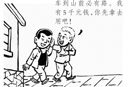
3. 老根头拉着墩子安慰着，并借钱给他。