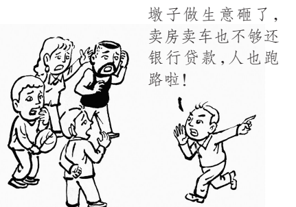
7. 半年后，不幸的消息传到村里……人们捶胸顿足、呼天抢地。