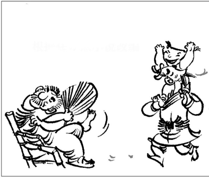
1. 大李和老王是邻居，两家因为一件事情闹翻，十几年了互不理睬。