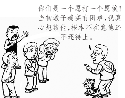
9. 老根头梗着脖子回怼众人……