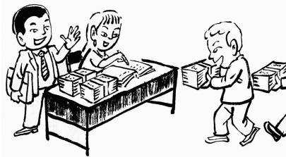
6. 没过多久，墩子为扩大经营规模又来借钱，并许诺给很高的利息，人们争先恐后地掏钱，不到半天钱就筹齐了。