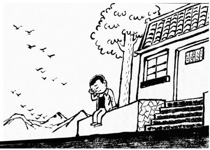
1. 墩子在城里打工多年，为了创业，他回村里借钱，未曾想，跑了一天也没借到，于是垂头丧气地坐在村口发愁。