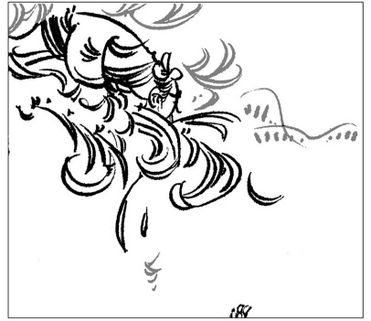
4. 大李连忙上前，心想：“无论如何总是条人命，不能见死不救。”