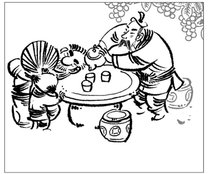
12. 人生最高的修养之一就是包容，说起来容易，真做到还挺难。