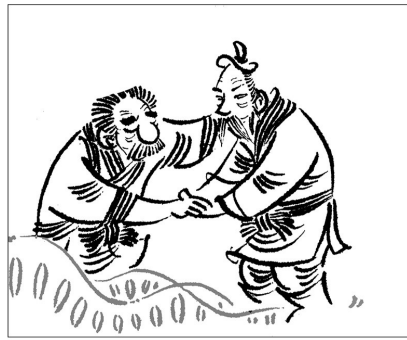
11. 俩人的手紧紧握在一起。从此，两家从老死不相往来变成特别要好的邻居。