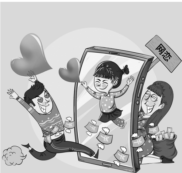
交友需谨慎 谭希光

陈先生与“女友”网恋4年,却从未见过面。他前前后后借给“女友”100多万元,“女友”失踪后,陈先生才发现不对劲。警方调查后发现,所谓“女友”竟是陈先生的发小雪某,雪某供述:“他挺好骗的,越骗越上瘾。”——连面都没见过,就一个劲儿转钱,果然“爱”会让人失去理性。