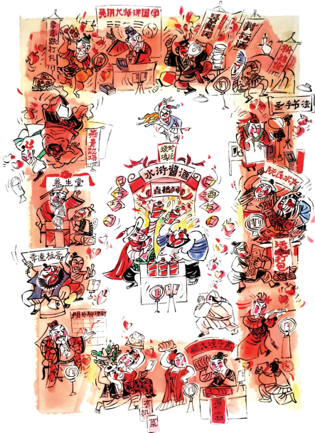
兄弟们都去开直播啦!

本届美展涌现了不少新面孔,作品质量上乘,这是令人鼓舞的现象。期待他们能成为漫画界的主力军,持续创作出更多优秀作品,守护并发展漫画的讽刺与幽默之魂。(作者系中国美术家协会漫画艺委会副主任)