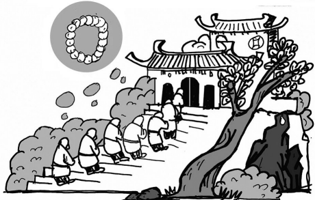
↑1.一座寺庙因藏有一串佛祖戴过的念珠而闻名。