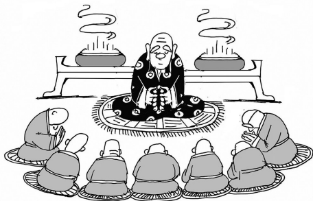
↑2.念珠的供奉之地只有庙里的老住持和7个弟子知道。

↓4.一天那串念珠突然不见了。老住持问7个弟子：“你们谁拿了念珠，只要放回原处，我不追究，佛祖也不会怪罪。”弟子们都摇头。