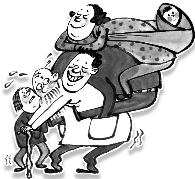
↑——爸妈，我们来陪伴你们啦！