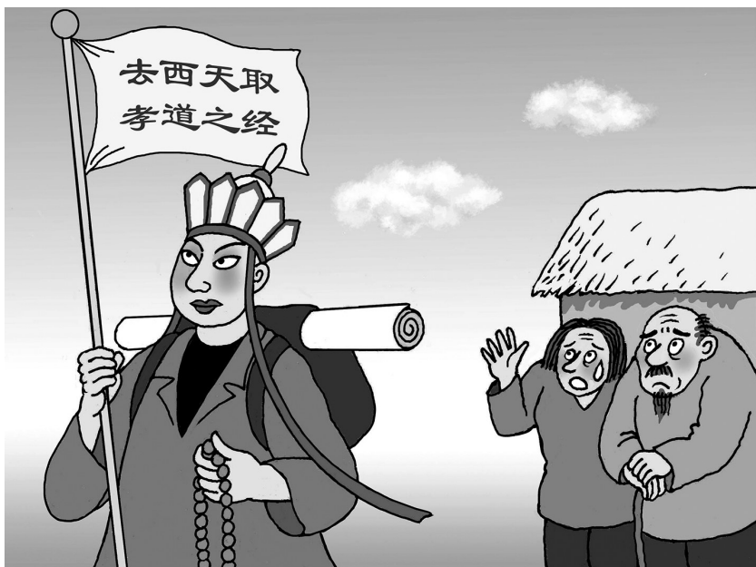
→取经何必西天万里遥