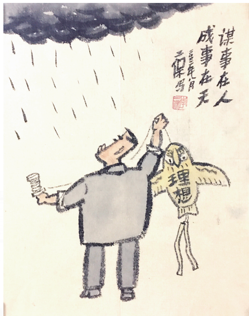
谋事在人 成事在天 李二保