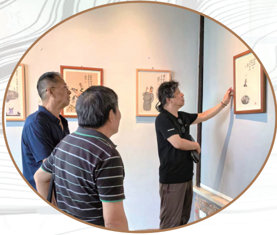
展览现场共同探讨