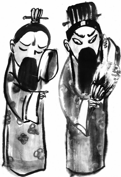
蹭“古人”流量 钱新明

近年来,“纪念刘备托孤1800周年”“纪念张飞诞辰1855周年”等活动多次冲上热搜,一些地方为了打造文旅IP,纷纷从“古人”下手。甚至还有自媒体炮制出“纪念潘金莲开窗950周年”“纪念孙悟空诞生1000周年”等名头。——蹭“古人”流量,如果缺乏文化底蕴,最终也只会沦为庸俗的噱头。