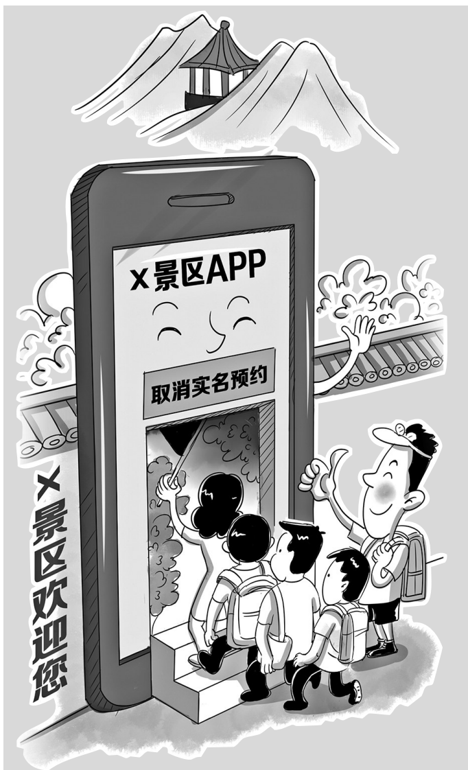
北京景区取消预约 小栗子

随着暑期旅游旺季的到来,北京市为持续提升旅游景区基本服务,除故宫、国博等旅游景区和对外开放单位外,全市的旅游景区已全面取消预约要求。