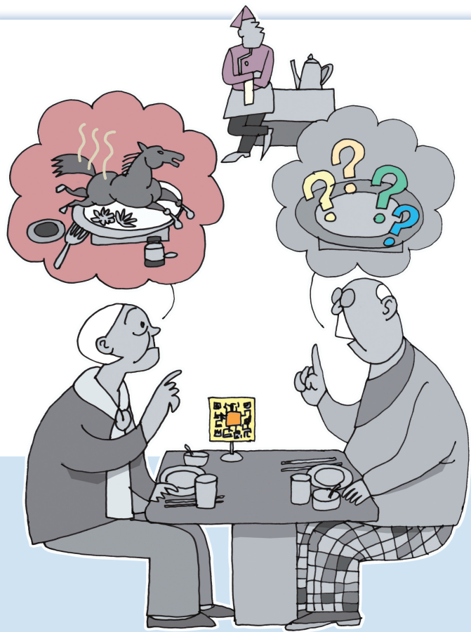
↑ 扫码 沈天星

——进来就叫我们『烧马』(扫码)，我又不吃马肉。—— 你不懂，他问『烧嘛』，就是问烧什么？