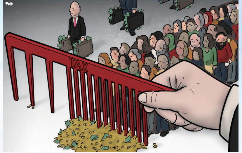
↑ 疏密有别 蒂尔德·罗亚兹(荷兰)

编者按 在西方社会,税收不公问题正日益凸显。通常,低收入群体往往承担着较重的税收,而高收入群体则通过各种手段规避税收。税收不公加剧了社会不平等,导致贫富差距不断扩大。