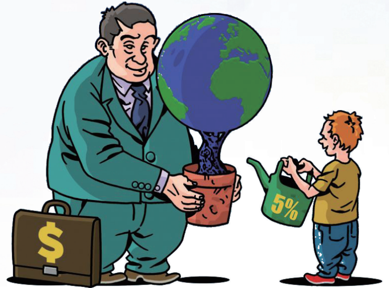
← 谁来浇灌 恩里科·贝尔图乔利(意大利)

编者按 在西方社会,税收不公问题正日益凸显。通常,低收入群体往往承担着较重的税收,而高收入群体则通过各种手段规避税收。税收不公加剧了社会不平等,导致贫富差距不断扩大。