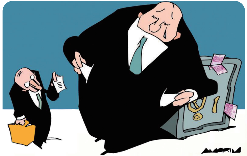
← 哭穷 阿莫林(巴西)