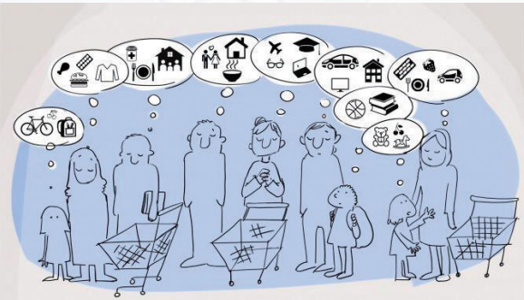
→ 收割梦想 塔拉瓦·尼基(英国)