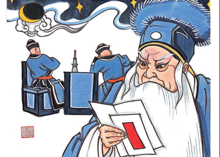
宋氏豪杰来搭救，救得异乡女子身。越衙告状击堂鼓，包揽词讼为干女。压书银子三百两，还望年兄念弟情。田伦书信被送到，要那顾读徇私情。