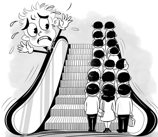
此一时彼一时 郎宏佰

前些年，乘电动扶梯时，大多提倡“左行右立”，即自动站到右侧，将左侧让给赶时间的人。最近人们发现，很多城市已不再提倡乘扶梯时“左行右立”，因为人们在扶梯上行走容易踏空或被绊倒，导致意外发生，另外长期“左行右立”会对电梯造成较大损害。