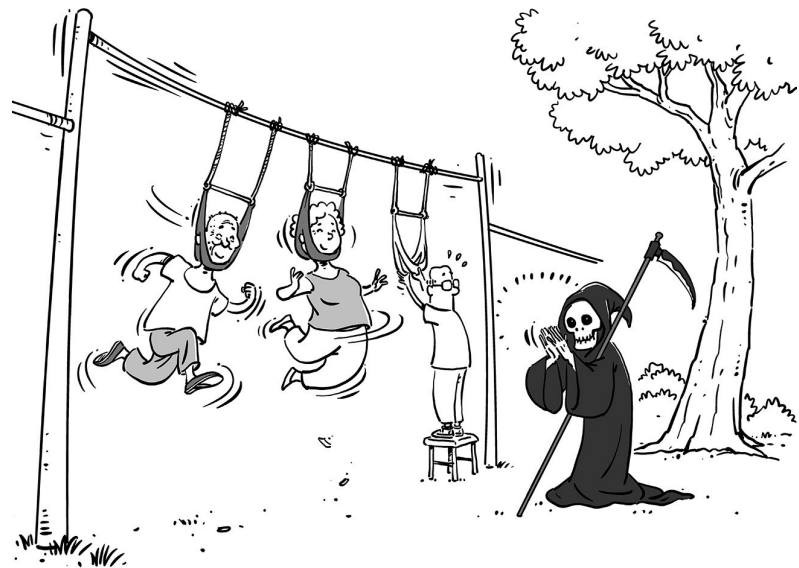
健身土方要不得 马宏亮

近日重庆一名男子以“吊脖子”的方式进行锻炼，结果发生意外不幸离世。近年来，一些人将绳索挂在脖子上，双脚离地，像荡秋千一样跟随绳索摇晃，前后摆动，声称这样能够缓解颈肩病痛，殊不知这有极大安全隐患。