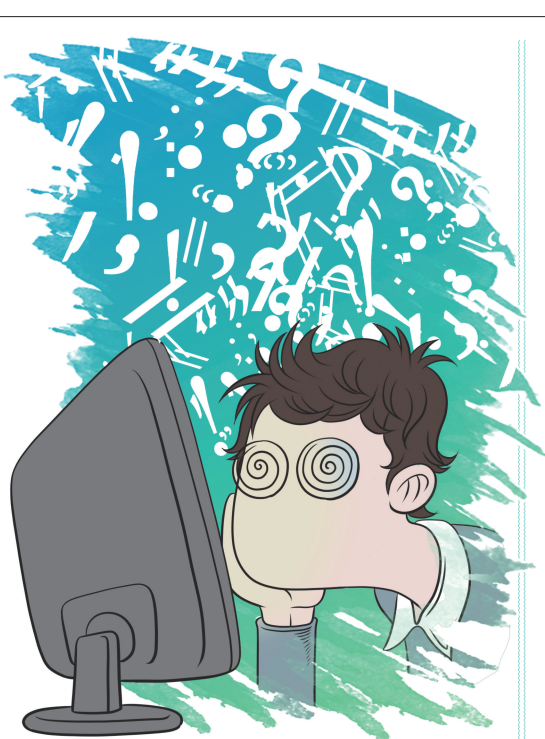
↑ 线上聊天用句号 让日本年轻人“倍感压力”

据日本《朝日新闻》报道,有些年纪稍大的日本人用社交软件聊天时会在一句话的末尾使用句号,但这让一些年轻人“倍感压力”。日本筑波大学助理教授岩崎拓表示,这可能和年轻人爱看日本漫画有关。日本漫画通常很少使用标点符号划分句子,因此年轻人一般不会对句末使用标点符号。若有人在句末用句号,会让对方觉得在传达某种情绪,因此产生心理不适。岩崎拓称:“这其实也是一种代沟。”