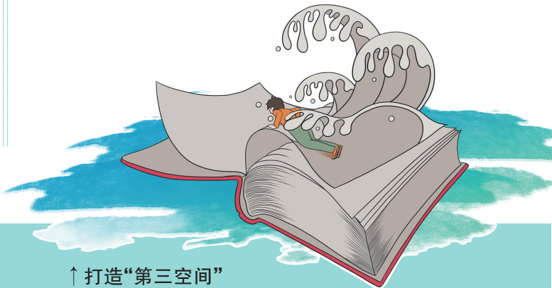
↑ 打造“第三空间” 英美年轻人爱泡图书馆

随着选举季来临,在 TikTok 上活跃的欧美政治人物越来越多,为吸引年轻选民,这些政治人物或拍摄时下流行话题相关的短视频,或记录自己的工作日常,一些人获得了数十万点赞,而另一些人则被恶评狂轰滥炸。