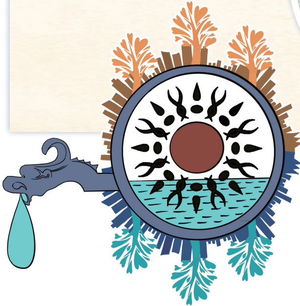
↑ 绿意祥字 赵曙合