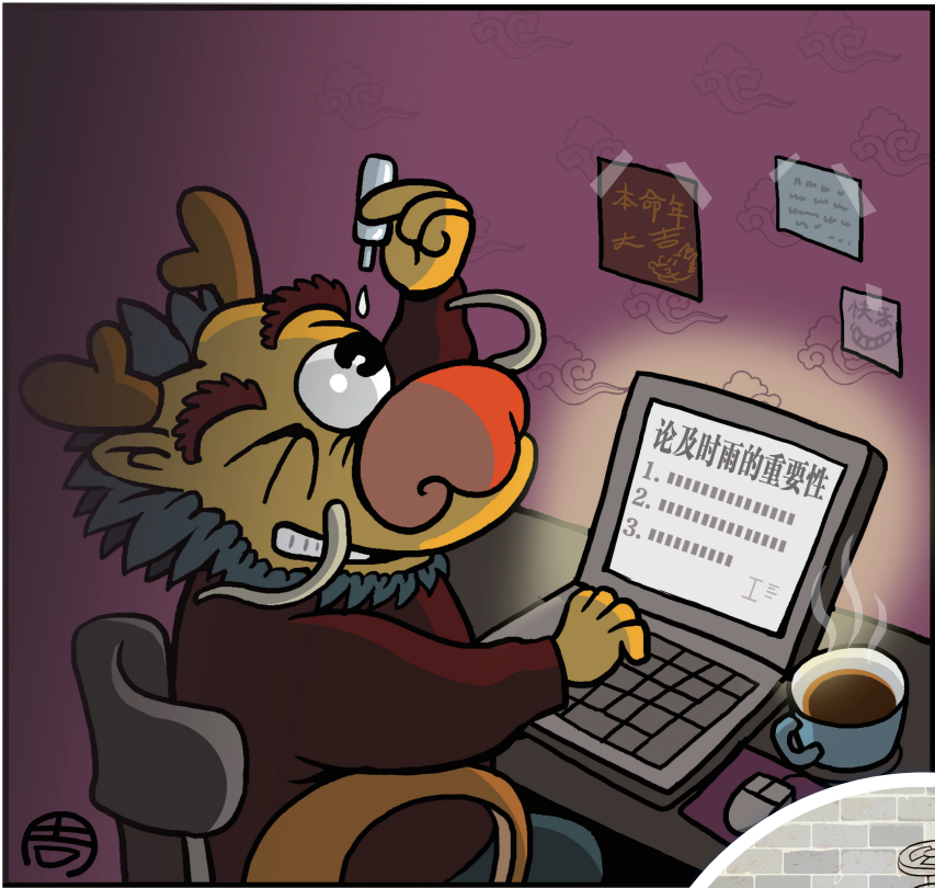
↑ 点睛 周喜悦