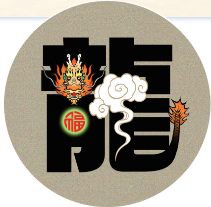
↑ 祥龙图 孙宝欣