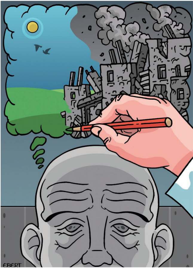
正面思考 恩里科·贝尔图乔利(意大利)