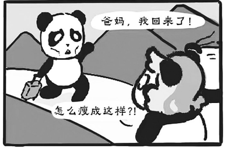
→ 逢年胖三斤 三金菜菜子