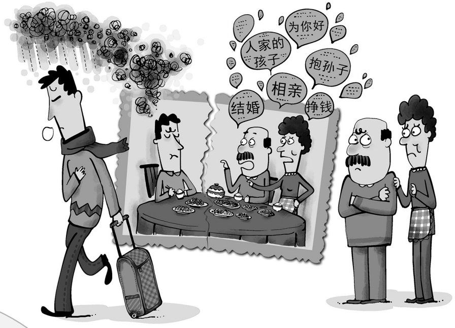
← 不欢而散 邱 炯

编者按 “每逢佳节倍思亲”，过年前，各种“突然回家”的小视频让人心生“早回家，早享福”的向往，然而回家后才发现，自己的福气很快就变成“早回家，早吵架”的困扰：“回家四天了，现在靠洗碗维持亲情”“四天？真羡慕你，我就两天”“春节回家，无异于往风暴的中心跑”“一过年就吵架，跟个魔咒似的”……由倍“思”亲到倍“撕”亲的变化因何而起？或许，我们能从画中觅得二三原因。