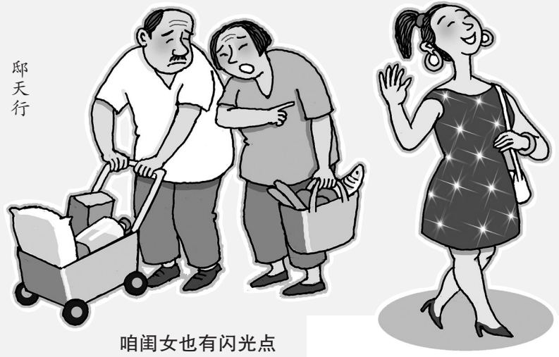
咱闺女也有闪光点