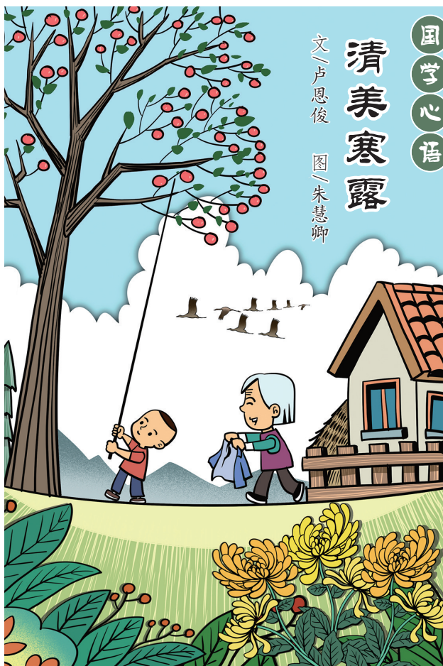
文/卢恩俊 图/朱慧卿