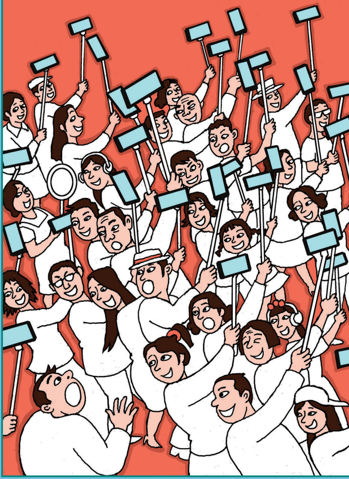
← 叫一声主播百人应