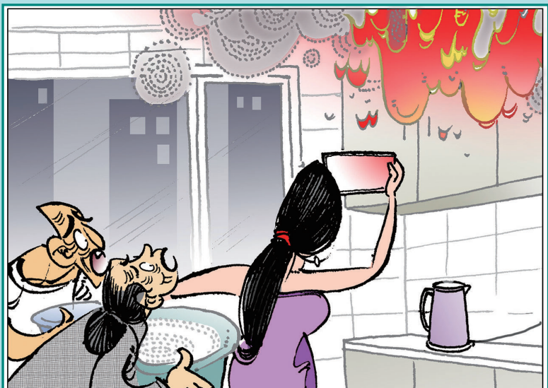
← 爷爷奶奶等一会儿，我拍个视频 马菁海