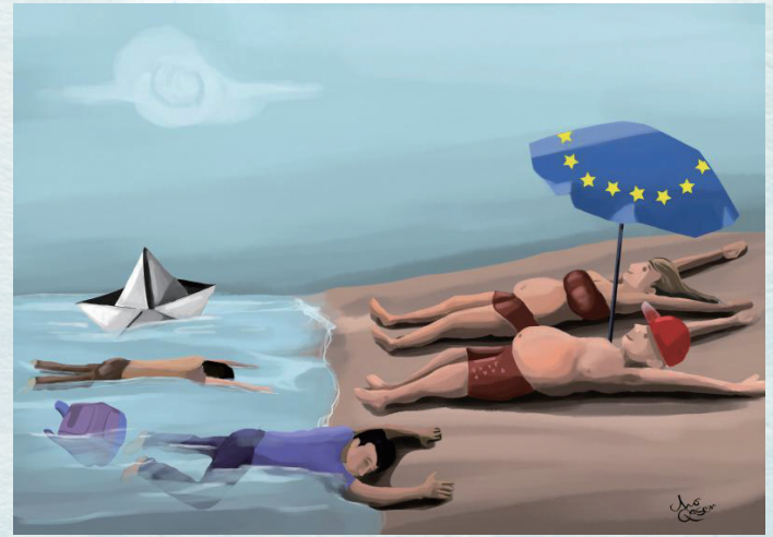
同一片海滩 莫卡森(荷兰)