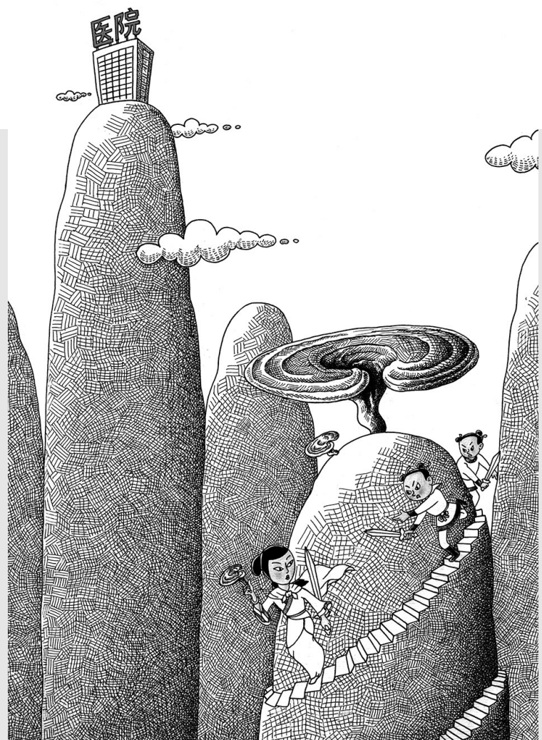
↑若非仁心价太高,何须白蛇盗仙草